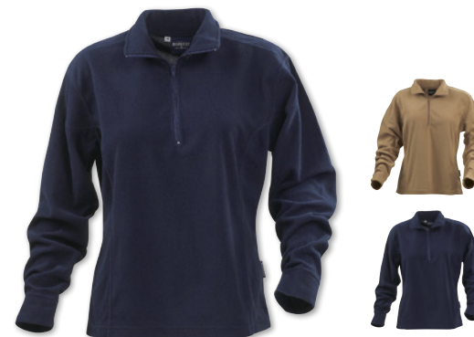
TAYLOR 2122021 ♀

Lättvikts fleecetröja i dammodell i micropolyester. Dekorsömmar samt dragkedja i halsen.