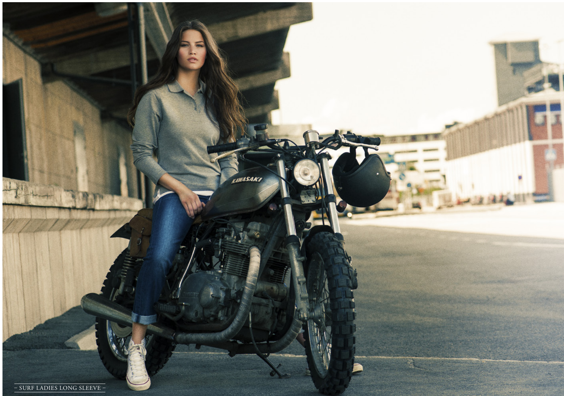
- SURF LADIES LONG SLEEVE -