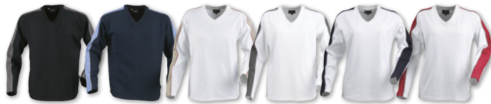
AKRON 2122012 ♀ Trefärgad V-ringad interlocktröja i dammodell.