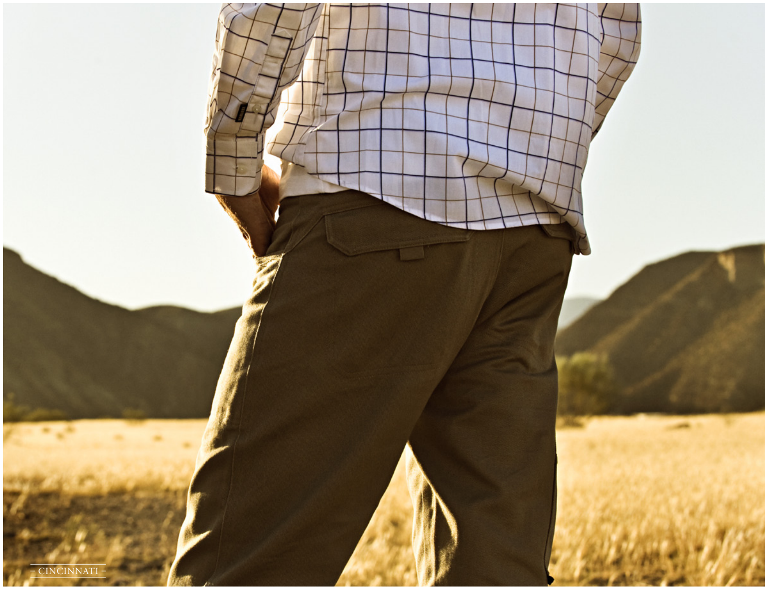
- CINCINNATI -