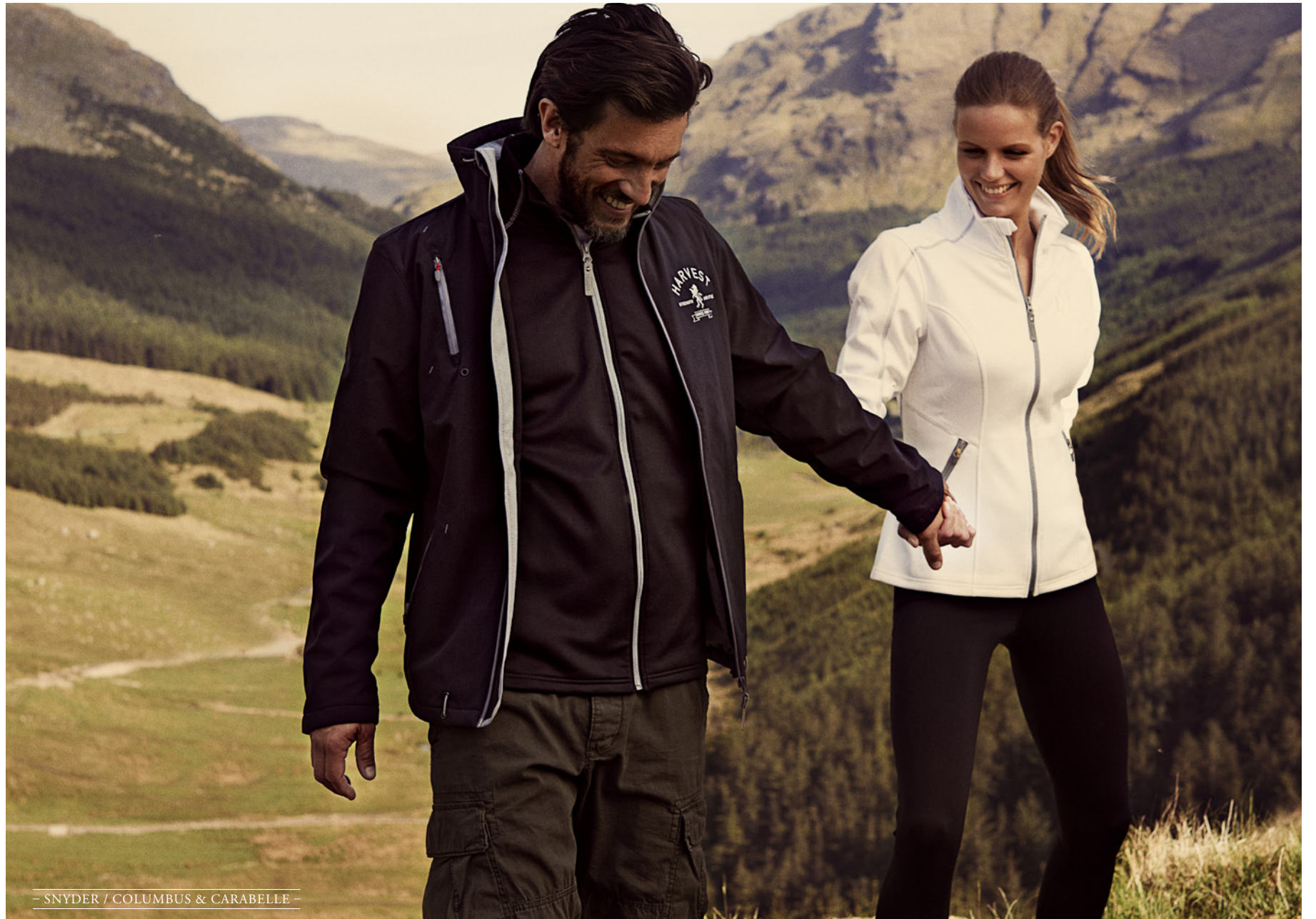
— SNYDER / COLUMBUS & CARABELLE —