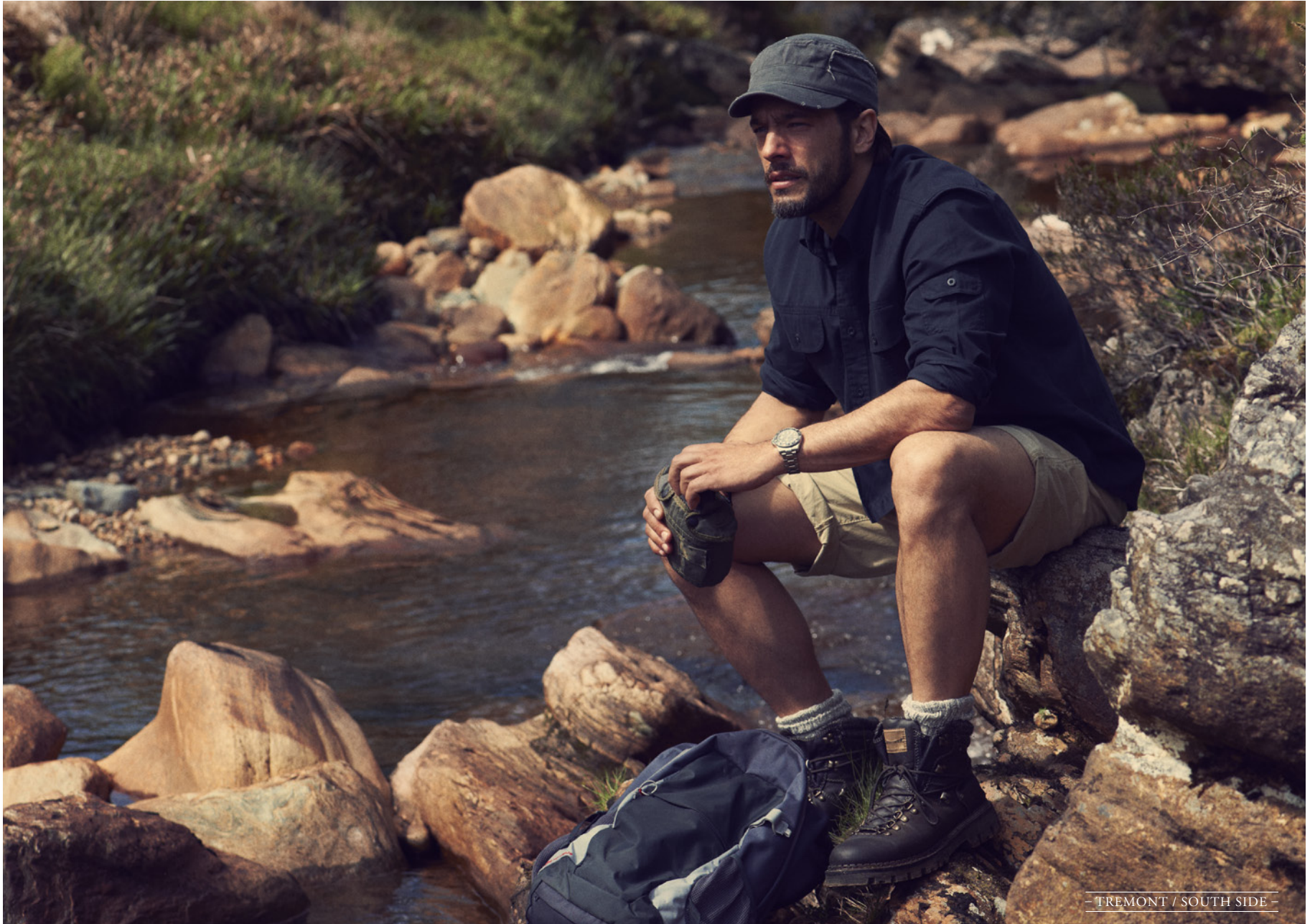
- TREMONT / SOUTH SIDE -