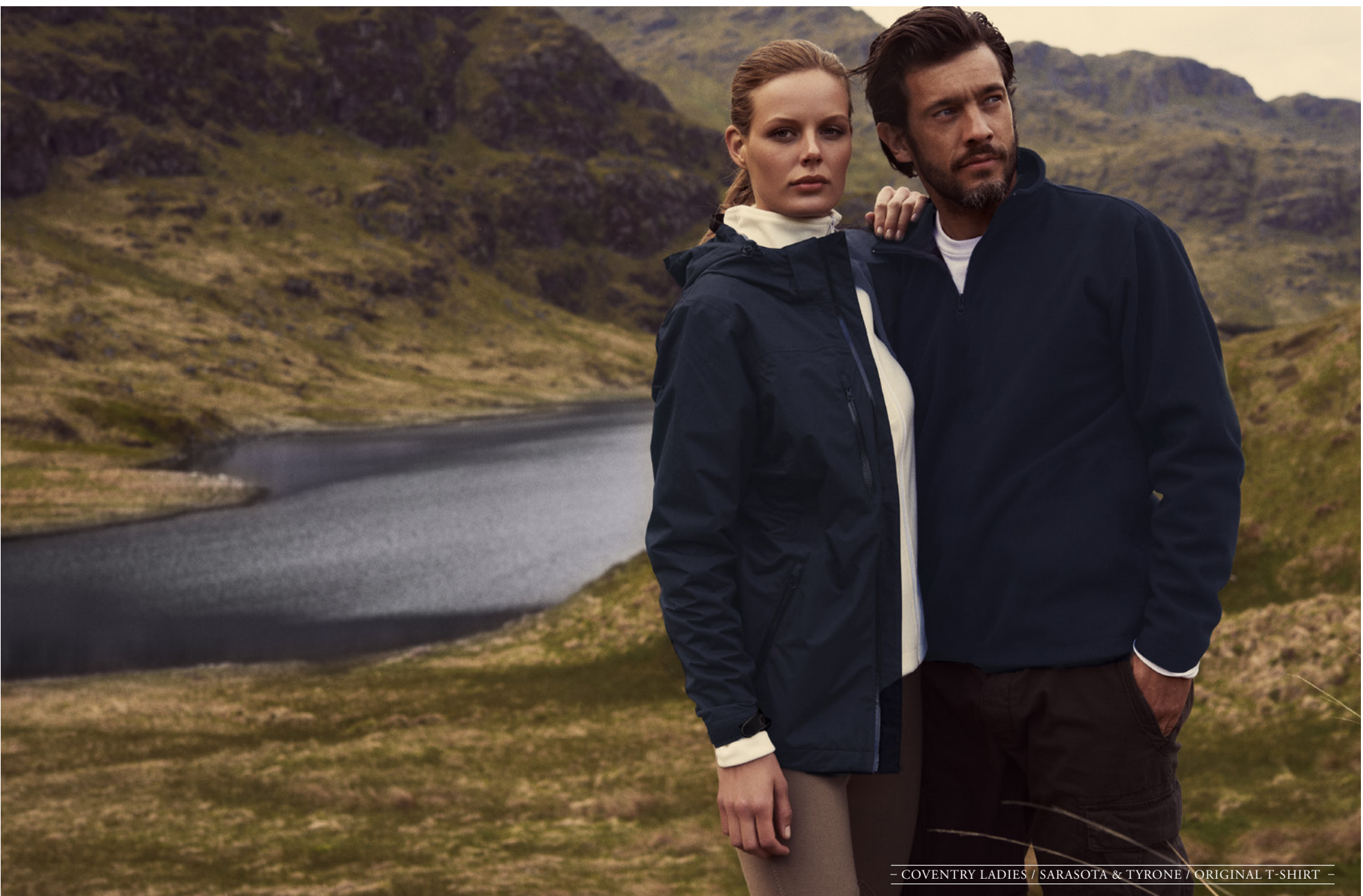
- COVENTRY LADIES / SARASOTA & TYRONE / ORIGINAL T-SHIRT -