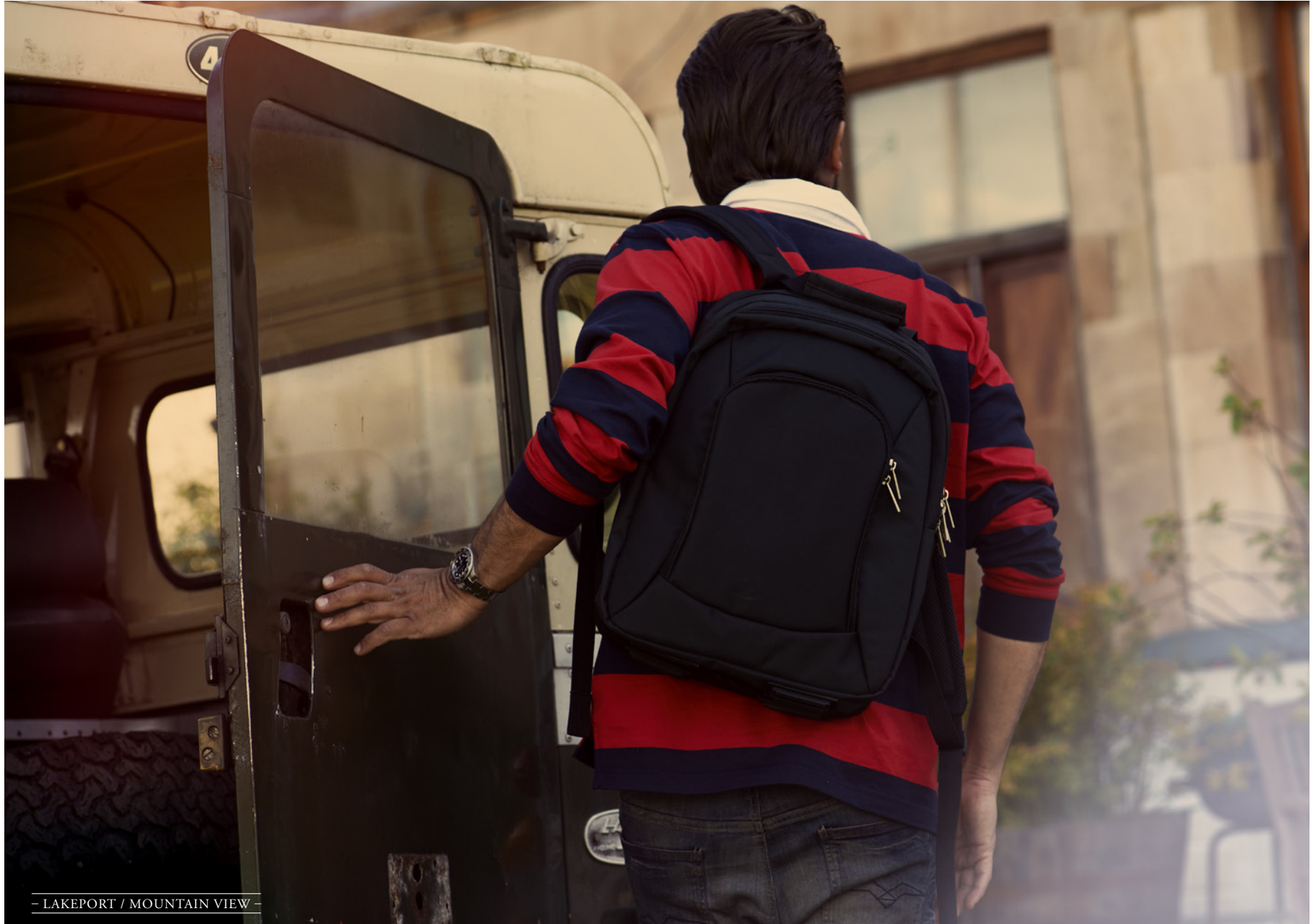
— LAKEPORT / MOUNTAIN VIEW —