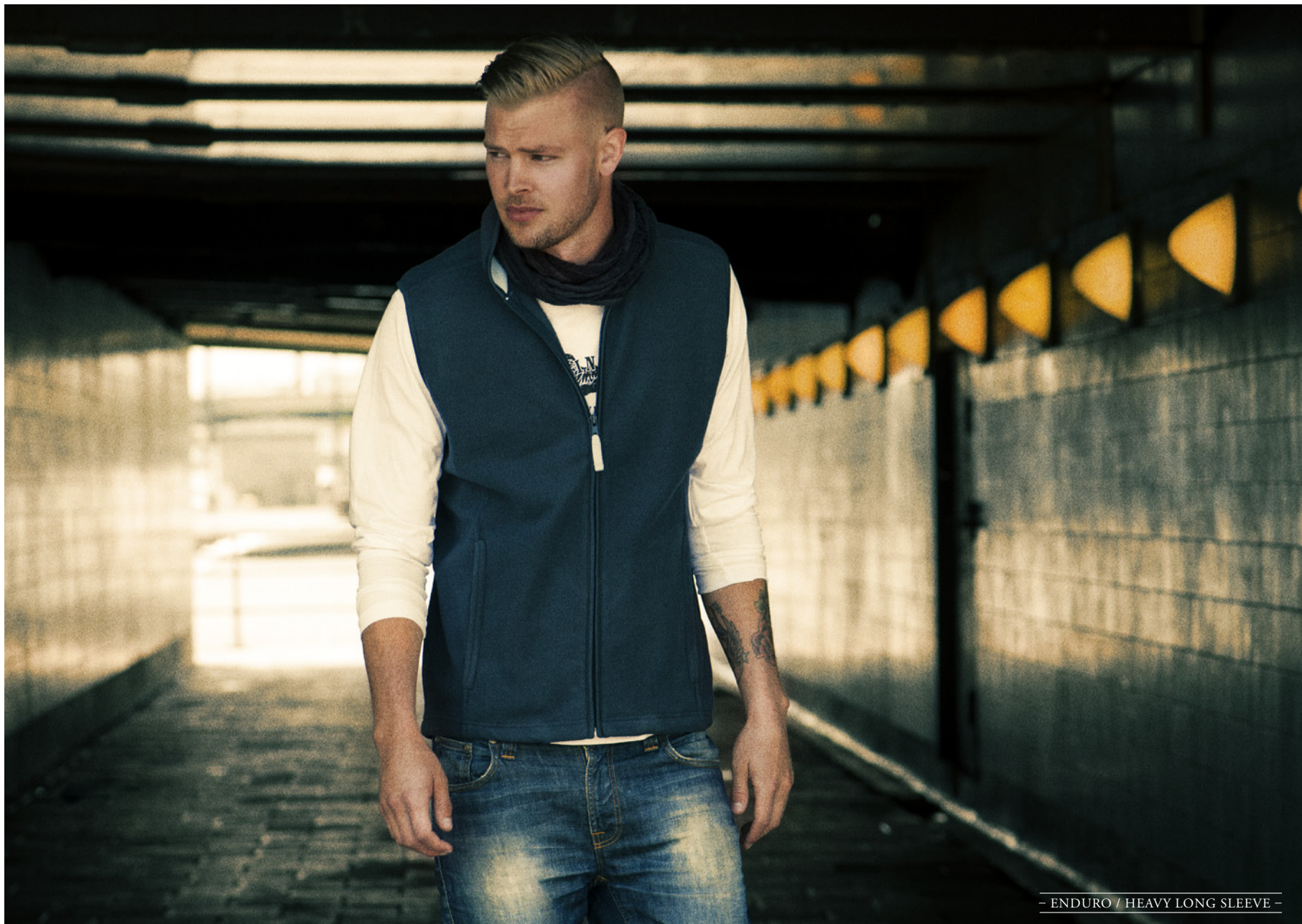
- ENDURO / HEAVY LONG SLEEVE -