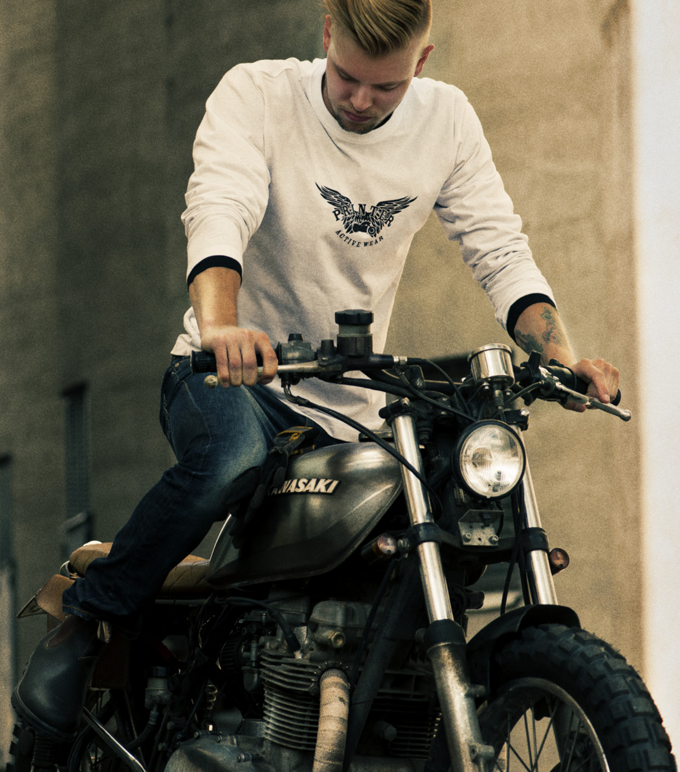
- HEAVY LONG SLEEVE -