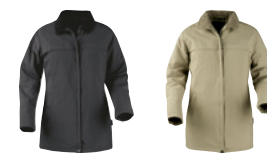
ADELAIDE 2121015 ♀