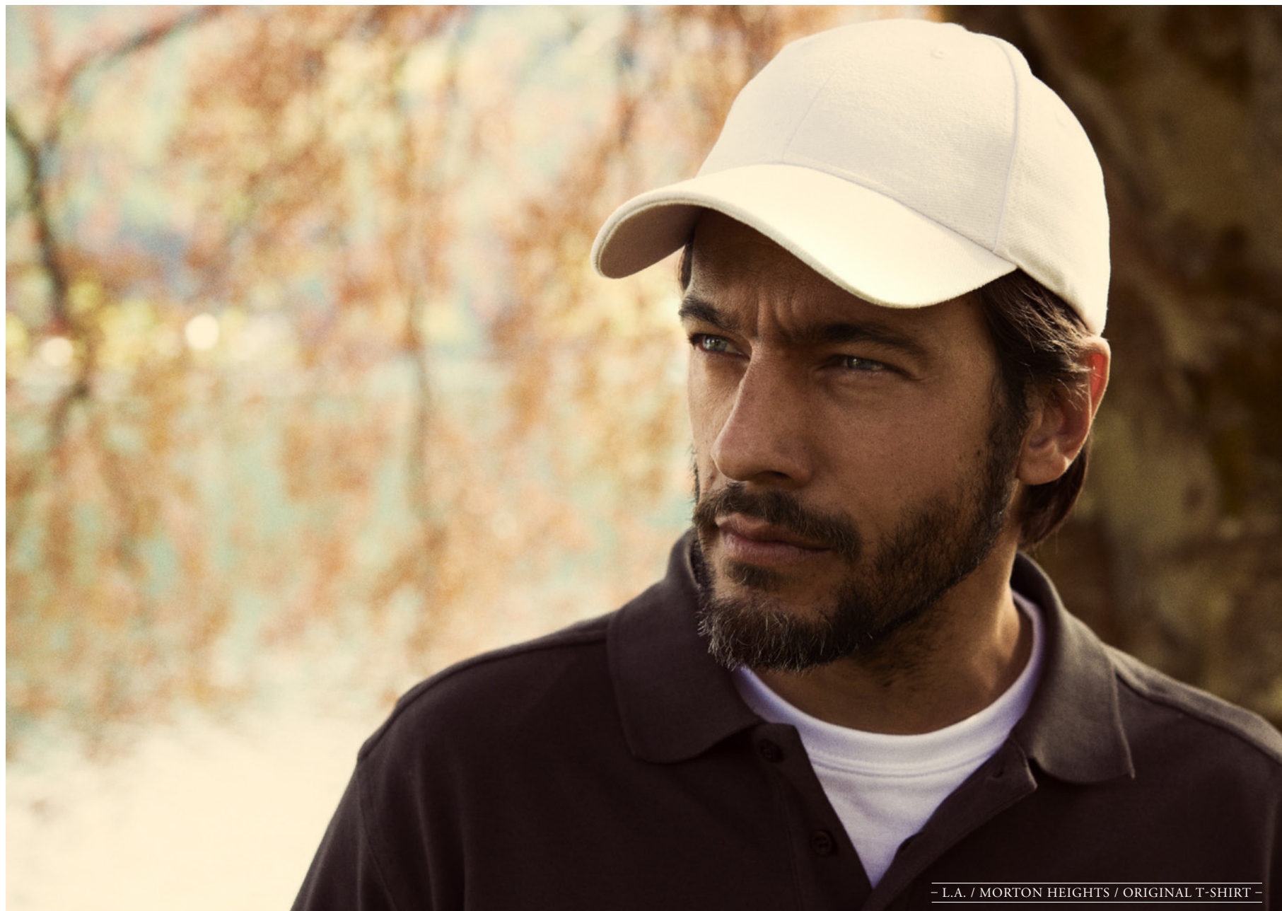
- L.A. / MORTON HEIGHTS / ORIGINAL T-SHIRT -