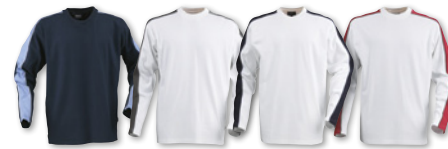
WILCOX 2132010 Trefärgad rundhalsad interlocktröja. Förlängt bakstycke och sidoslitsar.