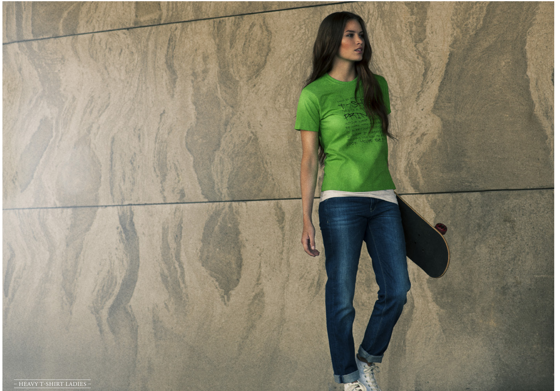
- HEAVY T-SHIRT LADIES -