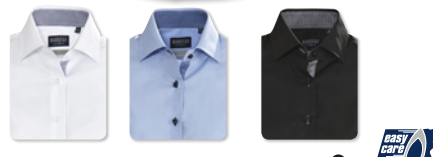
BALTIMORE LADIES 2123020 ♀

Kvalitetsdamskjorta i kammad bomull. Easy care behandlat tyg och förstärkta sömmar, krage samt ärmslut för lättare skötsel. Enfärgad med kontrast inuti kragen, knappså och ärm nedtill.